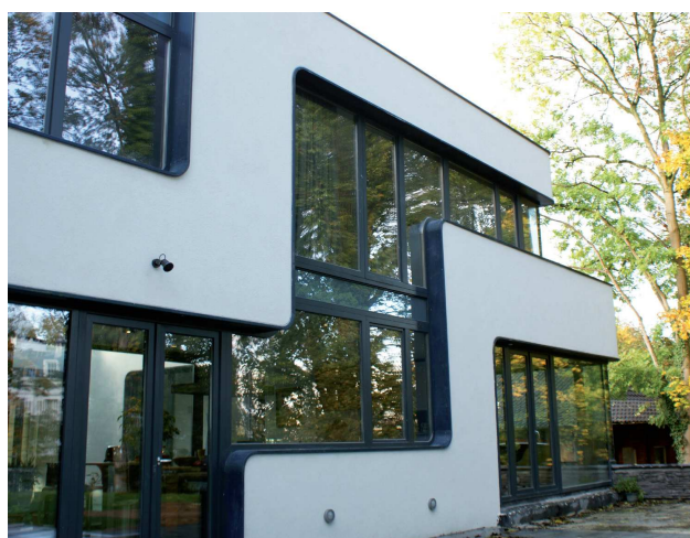
Finitions et liberté architecturale

Ligne de production d'un mur de maison MHM